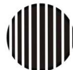
SEGUNDA VISTA RAYADA

TALLAS: UNITALLA MATERIALES: VINIPIEL, ALGODÓN 100% COLORES: NEGRO / RAYAS